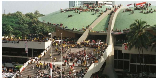
Gambar 4. Demonstrasi Mahasiswa di Gedung DPR RI Mei 1998

Ruang (dimensi spasial) sebagai unsur sejarah merujuk tempat yang dalam aspek aspek letak geografis suatu kejadian yang dialami manusia. Aktivitas yang dilakukan manusia pada waktu tertentu pasti berada pada ruang tertentu pula. Keterlibatan ruang yang jelas inilah yang akan mempermudah pembaca generasi selanjutnya bisa memahami secara utuh sebuah peristiwa sejarah yang real terjadi. Ruang merupakan tempat terjadinya berbagai peristiwa alam maupun peristiwa sosial dan peristiwa sejarah dalam proses perjalanan waktu. Konsep ruang dapat mempunyai arti sebagai konsep yang paling melekat dengan waktu.