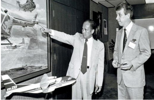
Gb 1. Menteri Negara Riset dan Teknologi, BJ Habibie Jakarta, 26 Januari 1983