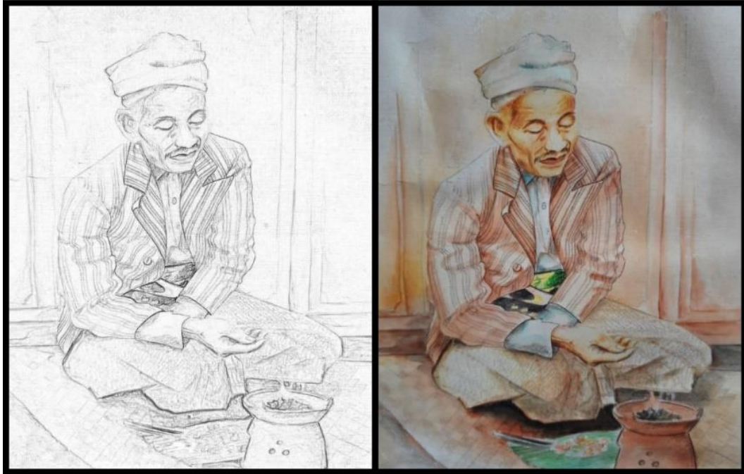
Gambar 2b: Membuat Gambar Ilustrasi dengan Tema Manusia dan Kegiatannya