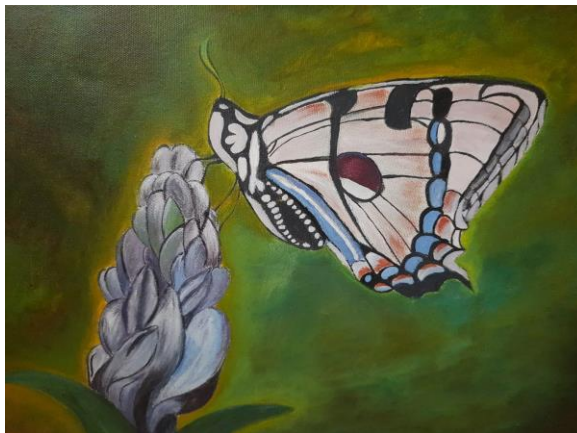
Gambar 1. Ilustrasi Lukisan